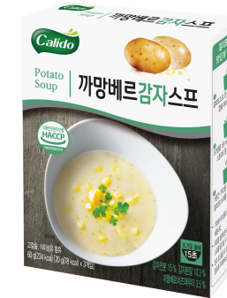
까망베르감자스프 Potato Soup

국내산 양송이를 넣어 버섯의 깊은 향과 진한 맛. 까망베르 치즈와 부드러운 크림이 조화를 이룬 고품격 버섯 크림 스프.