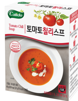
토마토칠리스프 Tomato Chili Soup 토마토분말 5%, 고춧가루 0.4%

고소하고 깊은 옥수수 향과 유익산 고품격 치즈와의 조화로 한층 깊은 고소함과 달콤한 맛이 매력적인 스위트 콘스프.