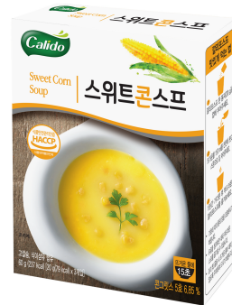
스위트콘스프 Sweet Corn Soup 콘그릿스 5호 6.85%

Calido soup made by JSM Food, the best company for food safety. It is easy to cook it in 15 seconds by pouring only hot water. And It contains calcium and dietary fiber, so that both busy modern people and growing children can enjoy it in a healthy and delicious way.