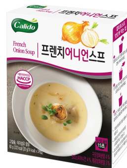
프렌치어니언스프 French Onion Soup 구운양파분말 4%, 크리스피어니언 4%, 볶음양파분말 3%

건강에 좋은 토마토 분말과 매콤한 칠리추출물, 국내산 고춧가루를 첨가하여 매콤하면서도 토마토의 깊은 맛을 살린 퓨전 스타일의 토마토 칠리 스프.