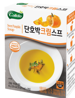
단호박크림스프 Pumpkin Soup 식물성크림1 25.3%, 식물성크림2 10.5%, 단호박분말 18.8%, 분말유크림 2.5%

로스팅한 양파의 깊고 진한 풍미에 부드러운 크림과 치즈의 조화가 매력적인 프렌치 어니언 스프.