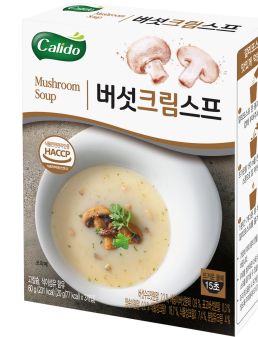
버섯크림스프 Mushroom Soup

버섯수프맛분말 2.2%, 새송이분태 0.9%, 표고버섯분말 0.3%, 양송이분말 0.2%, 식물성크림1 18.7%, 식물성크림2 7.4%, 분말유크림 4%